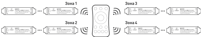
Рисунок 3. Вариант построения системы с 4-зонным пультом дистанционного управления